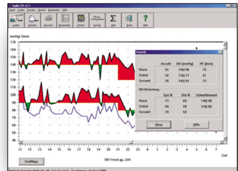
Agilis CD: Statistische Interpretation